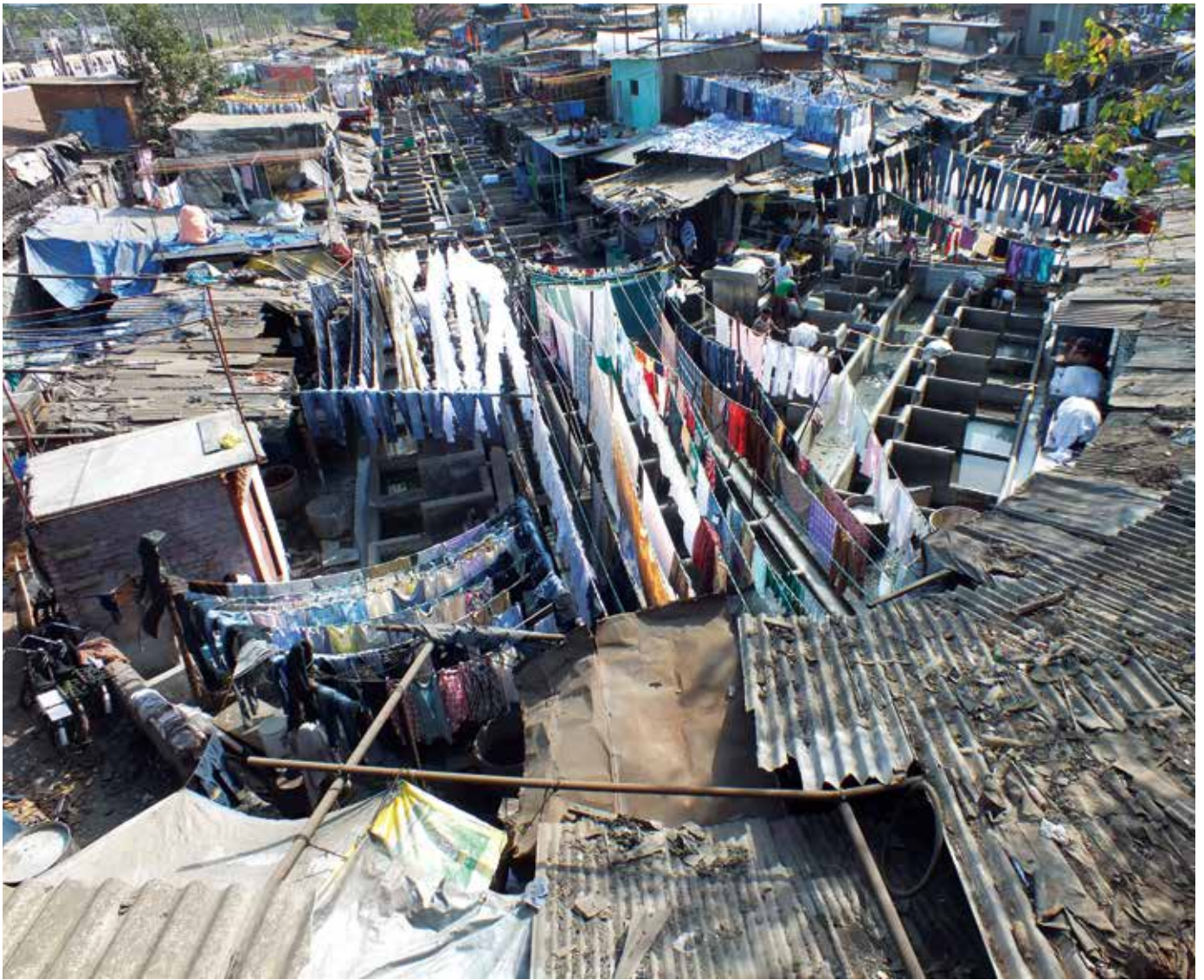
Sloppenwijken in Calcutta

lijden aan TBC, Aids, en andere hoogst besmettelijke ziekten is hygiëne er van geen belang. De patiënten worden er behandeld met goede woorden en onvoldoende (soms verouderde) medicijnen, aangebracht met oude naalden, gewassen in lauw water. Men hoort het gehuil van mensen bij wie de wiken uit open wonden worden gehaald zonder pijnbestrijding. In overeenstemming met Moeder Theresia's bizarre filosofie, is het mooiste geschenk dat men kan geven het deelnemen in het lijden van Christus. Volgens de legende probeerde zij eens een schreeuwende, lijdende man te troosten: "Jij ben taan het lijden, dat betekent dat Jezus je kust." De man werd woedend en schreeuwde terug: "Zeg dan aan Jezus dat hij stopt met mij te kussen."