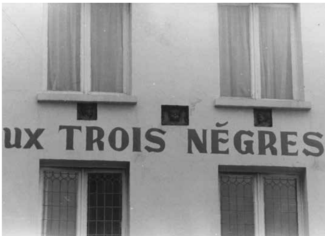
Figuur 1. Vroegere gevel van café. Café de Drie Moren . Kortrijk, Graanmarkt.

MAURITIUS is christen en meestal wordt hij als Moor getoond, vaak ook als Egyptische Kopt , met een donkere huidskleur. Zijn legioen is eveneens grotendeels christelijk. Volgens de legende wordt hij naar Gallia geroepen om een opstand neer te slaan. Bij de tocht door de Grote-Sint-Bernard-Pas weigert hij en zijn manschappen de Romeinse goden aan te bidden. Ook