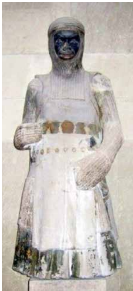
Figuur 3. Magdeburg , Kathedraal.

In elk geval ontstond door deze legende een lucratieve relikwieënhandel vanuit Sankt-Moritz die zich kon bevoorraden aan een nabij gelegen massagraf. De monniken van het klooster konden daardoor talrijke 'echte' Thebaanse relikwieën vinden die in theorie van MAURITIUS of zijn kompanen afkomstig waren. Zo is het 'denkbeeldige' lichaam van SINT-MAURITIUS samen met sommige van zijn even denkbeeldige compagnons in het jaar 961 overgebracht naar de kathedraal van Magdeburg ( Duitsland ) om er aanbeden te worden tot meerdere