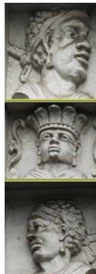
Figuur 2. Details

Op de Graanmarkt te Kortrijk is het café De Drie Moren of Aux Trois Nègres gevestigd. Het wordt al vernoemd vanaf 1841. In de XVde eeuw was de huisnaam Et Moriaenshoofft . In de gevel van het huis zijn drie gevelstenen te zien welke elk een MOOR voorstellen.. De gevelstenen waren vroeger zwart zoals op de foto, doch ze zijn nu wit geschilderd. De details tonen o.a. twee MOREN met de typische hoofdband.