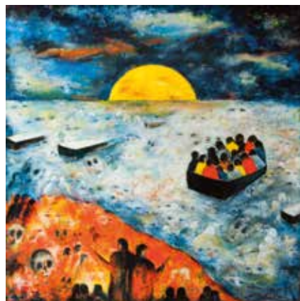
Dirck Saey: schilderij (olie op papier)