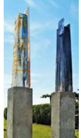
My Orange Me-Tower & Blue Mind-Tower

Zoeklicht: Wie ben jij en waar kom je vandaan ?