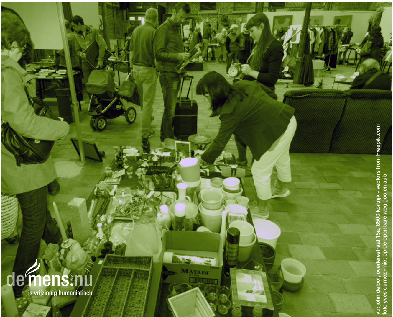
vu: john deloof, overleistraat 15a, 8500 kortrijk - vectors from Freepik.com foto yves durmez - niet op de openbare weg gooien aub

Za 15 okt 2016 13.30 tot 17.00 u VC Mozaïek - Kortrijk bruikbare spullen geven of meenemen. alles gratis!