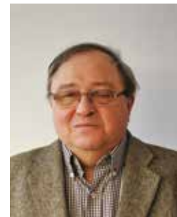
Auteur: Dirk De Meester

Nu we toch het diepe West-Vlaanderen achter ons hebben gelaten, kunnen we misschien even de taalgrens over wippen. In het voor het overige enigszins vervallen en slaperige Lessines vinden we het goed bewaarde middeleeuwse Hopital Notre-Dame à la Rose. Een groot complex met klooster en hospitaalzalzen. Het werd opgericht door de kannunikessen van Sint-Augustinus, adellijke vrouwen die hun abdij bouwden op de Dender en ervoor zorgden dat ze onder meer de visrechten en de tolrechten op de rivier als financiële basis in handen kregen. Nonnen zijn niet gek als het om geld gaat en ook qua werkkrachten beschikten ze over werkzusters die niet moesten worden betaald. Maar hun hospitaal ontving armen en daklozen. Nu is er een zeer instructief museum in ondergebracht, waarin u de geschiedenis van de geneeskunde kunt bekijken. Er zijn ook Nederlandstalige gidsen en er zijn audiogidsen. Vooral de chirurgische instrumenten zullen de moderne mens met afgrijzen vervullen maar ook de verpleegkundige instrumenten ontbreken niet. Het museum heeft ook een kunstcollectie waarvan een schilderij van de gekruisigde Here Jezus met een paar welvoorziene borsten misschien wel de grote blikvanger