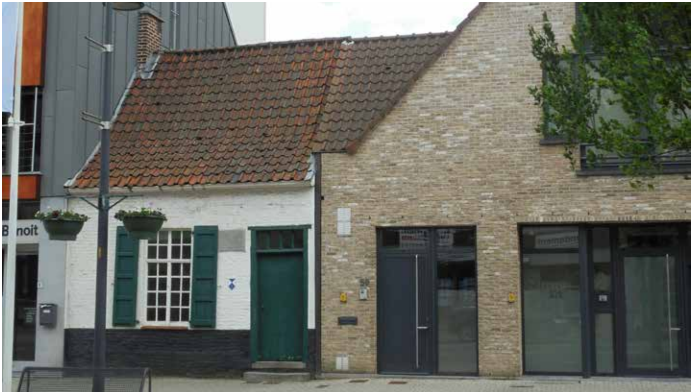
Buurhuisje van Peter Benoit

Tot zover vakantie in Harelbeke. En gezien de stad Harelbeke me niet wil betalen om de stad nog meer te promoten, schakel ik maar over naar een ander dorp. Als IK niet over die gemeente spreek, zal niemand dat doen.