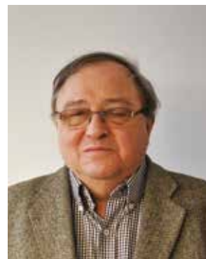
Auteur: Dirk De Meester

Men kan misschien nog enig begrip opbrengen voor mensen die in hun