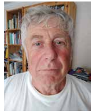
Auteur: Lieven Vanhoutte

“Het thema van Beaufort 21 ligt in het verlengde van haar voorganger in 2018. Een terugkerend onderwerp in de kunstwerken van deze editie is hoe de mens onderhevig is aan de wil van de natuur. Als de hoogbouw aan de Kust af en toe de vraag oproept ‘hoe heeft de mens de Kust veranderd’, dan